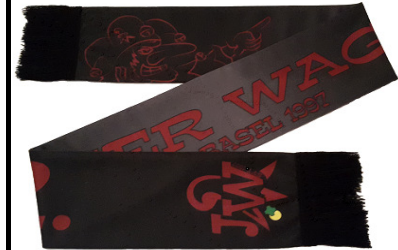
Syydeschaal, baidstytig bedruggt: 20.-

Am 25. Hoornig 2017 isch der brandneu Syydeschaal intäärn vorgstellt worde.