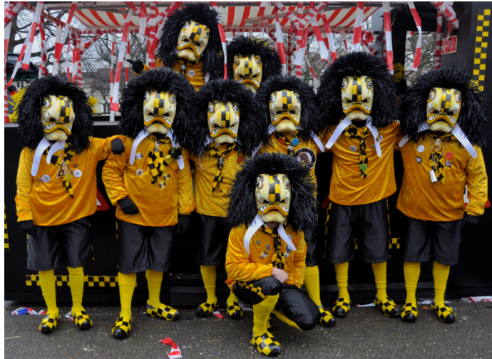
S'Gruppfeteli vo der Basler Fasnacht 2016 ... laider nit mit Vollbestand.