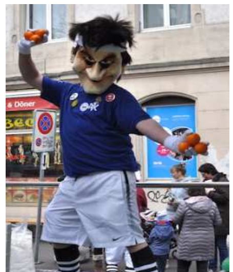
Im Geegesatz zem Original s'erscht Mool uff der "Tour" derby: Unsere Neuling 2018