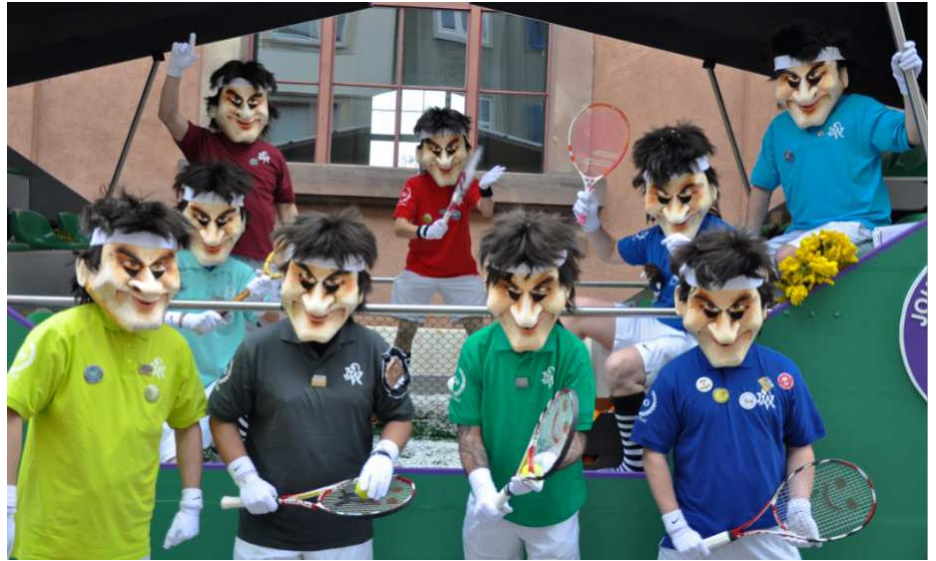
Alles Roger oder waas? Grupfefotti wäärend em erschte Halt am Fasnachts-Mäntig 2018